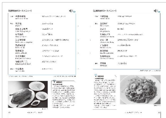
〈メニューページ例〉