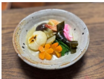
八福の彩り いなむどうち一雑煮 ～沖縄伝統×新春～