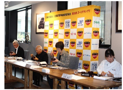
過去の実食審査の様子