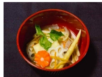
イナクル(幸せ)貝舌雑煮