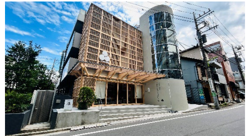
東京すし和食調理専門学校外観