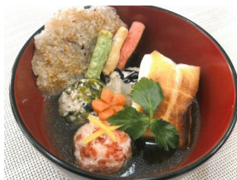
伊勢の恵み雑煮～伊勢芋入りつくねと伊勢茶漬け仕立て～