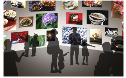
※画像はイメージです。実際の展示内容は変更になる場合があります。

繊細な技法や四季の表現といった和食の魅力を大画面の美しい映像で紹介。触れて楽しむデジタルアートにも注目です。