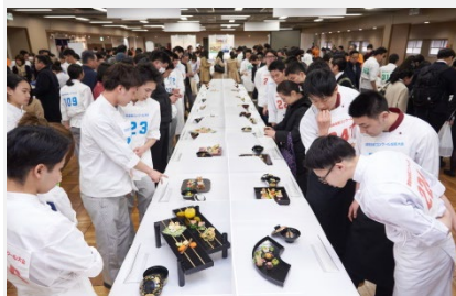
前回の決勝大会会場風景