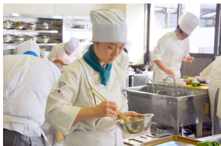
[日本料理部門]調理作業風景

選手は日本・西洋・中国の3料理部門のいずれかを選択し、学内選抜を経て、地区大会に出場します。地区大会では基本的な技術を競う課題に取り組みます(2ページ目参照)。審査員は各地区の教員が務めます。