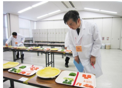
[中国料理部門]審査風景