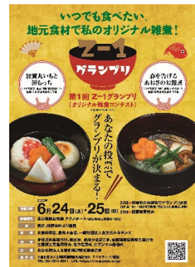
第1回Z-1グランプリ最終審査のポスター