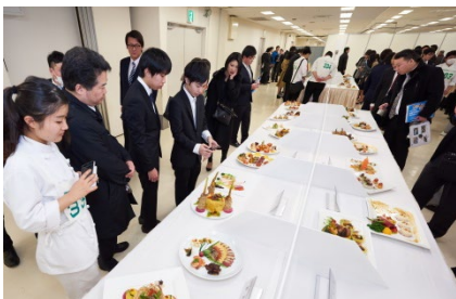
前回の決勝大会会場風景